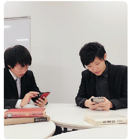
課外学習中にHandbookで資料を閲覧