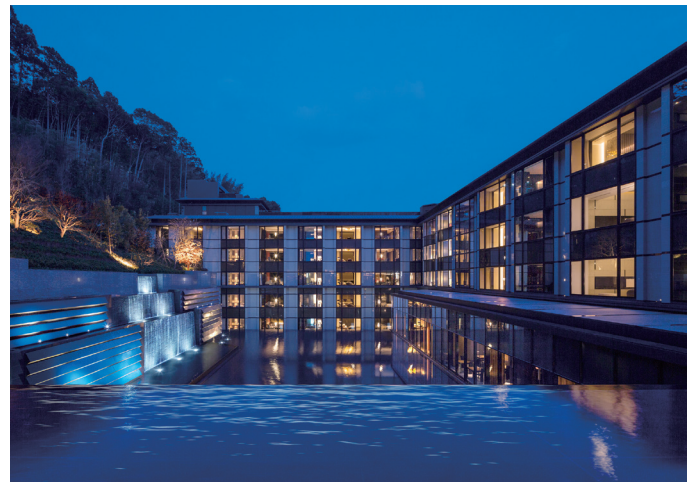
エクシブ湯河原離宮

パンフレット、宿泊プラン、レストランのメニューなどをPDF化。拠点・施設ごとにまとめて登録し閲覧性を高め、顧客自身に自由に閲覧してもらうことで、意外な施設がお客様の興味を引きつけ、新たな商談につながるなどの効果が生まれている。